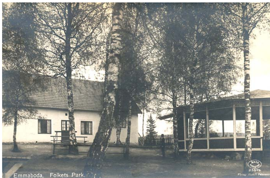
Det gamla Folkets Hus, uppfört 1920.

Ekonomin räckte fortfarande inte till en ny samlingslokal, men bekymret löstes tillfälligt 1910 genom att uppföra en större dansbana, som kunde byggas in och därmed användas som samlingslokal även vintertid. Det dröjde till 1920 innan ett riktigt Folkets hus invigdes på samma plats, där man sedan 1907 hade arrenderat marken för dansbanan. Föreningen köpte några år senare tomten,