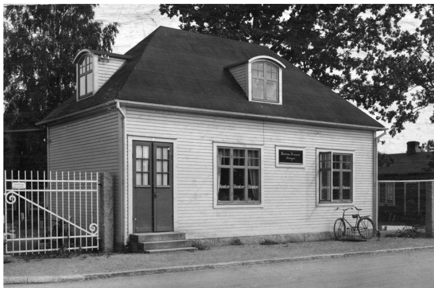
Bröderna Svenssons kontor på Storgatan. Till höger skymtas fabriken.