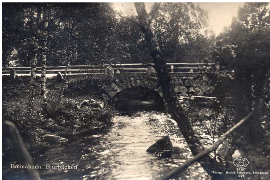
Bjurbäcken, 1924. Bron byggdes 1878 och revs sedan 1943 i samband med att Storgatan breddades.

Den 13 dec 1929 öppnades Emmaboda varmbadhus för allmänheten och en baderska anställdes. Under första året togs 3047 bad och avgiften var 25 öre per bad. Med hjälp av ett kommunalt bidrag kunde man erbjuda fria skolbad från år 1931. Emmaboda köping övertog 1933 ansvaret för badhuset, men själva driften skedde fortfarande i Röda korsets regi.