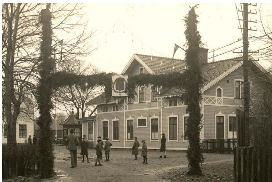
Stationen pyntad i anledning av köpingsinvigningen nyårsafton 1929. Järnvägshotellet till vänster.

Lördagen den 8 augusti 1874 invigdes Kalmar-Emmaboda järnväg av kungaparet Oscar II och drottning Sofia. Stationshuset var rikt smyckat med blommor, flag-