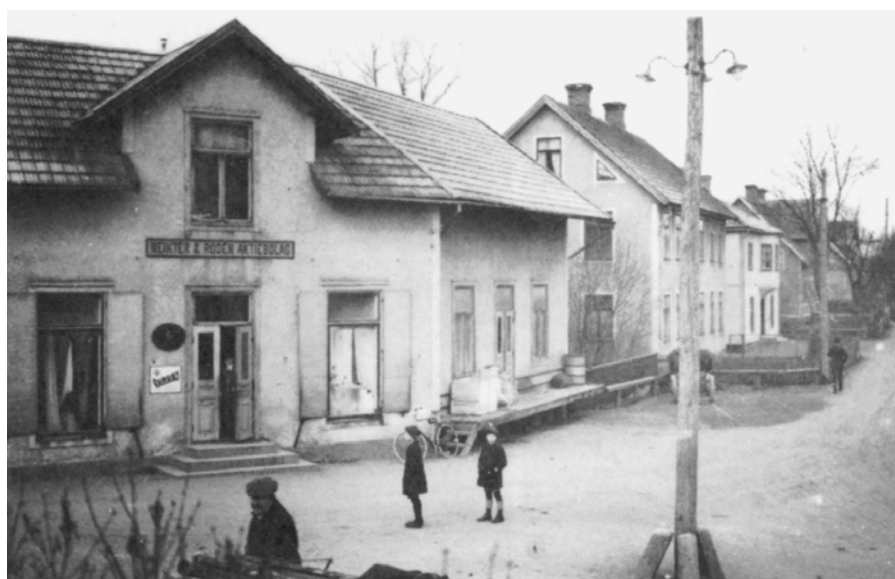
Hörnboden på 1920-talet.