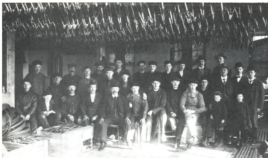
Anställda med chefer vid AB EJ Carlström & sons velocipedfabrik år 1920.