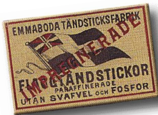
Tändsticksask från Emmaboda Tändsticksfabrik.

Möllers söner och dotter engagerades också i driften av den nya tändsticksfabriken, som i början drevs nästan helt utan maskinell utrustning. Tändstickorna förpackades i små papperspaket och såldes till grossister och detaljhandlare. Ett förbud mot de hälsofarliga fosfortändstickorna kom 1901, men då hade man redan i Emmaboda några år tidigare gått över till att tillverka säkerhetständsticken.