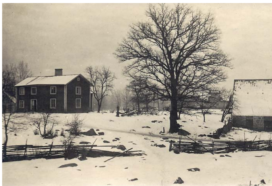
Mangårdsbyggnaden och ladugården på Gantesbo A medan gården ännu var bondejord, 1923.

Från 1961 fanns inte längre bynamnet Gantesbo kvar. Emmaboda stationssamhälle hade då helt uppslukat de båda gårdarna i byn.