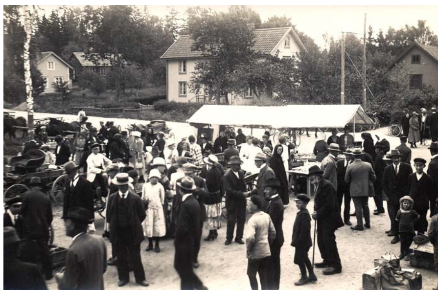
Marknadsbild från 1923, sista året som marknader hölls på denna plats framför Neikters magasin.

Vid torgdagarna, som hölls två fredagar i månaden, såldes det matvaror, jordbruks-, trädgårds- och hantverksprodukter samt levande