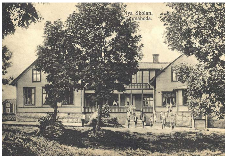
Norra skolan var i bruk mellan 1911 och 1968.

Karlskrona-Växjö Järnvägsaktiebolag skänkte då ett större markområde för skolhusbygge i samhällets norra del, vid Gantesbo gård. Den 15 augusti 1911 togs det nya skolhuset i bruk, då 123 barn skrevs in