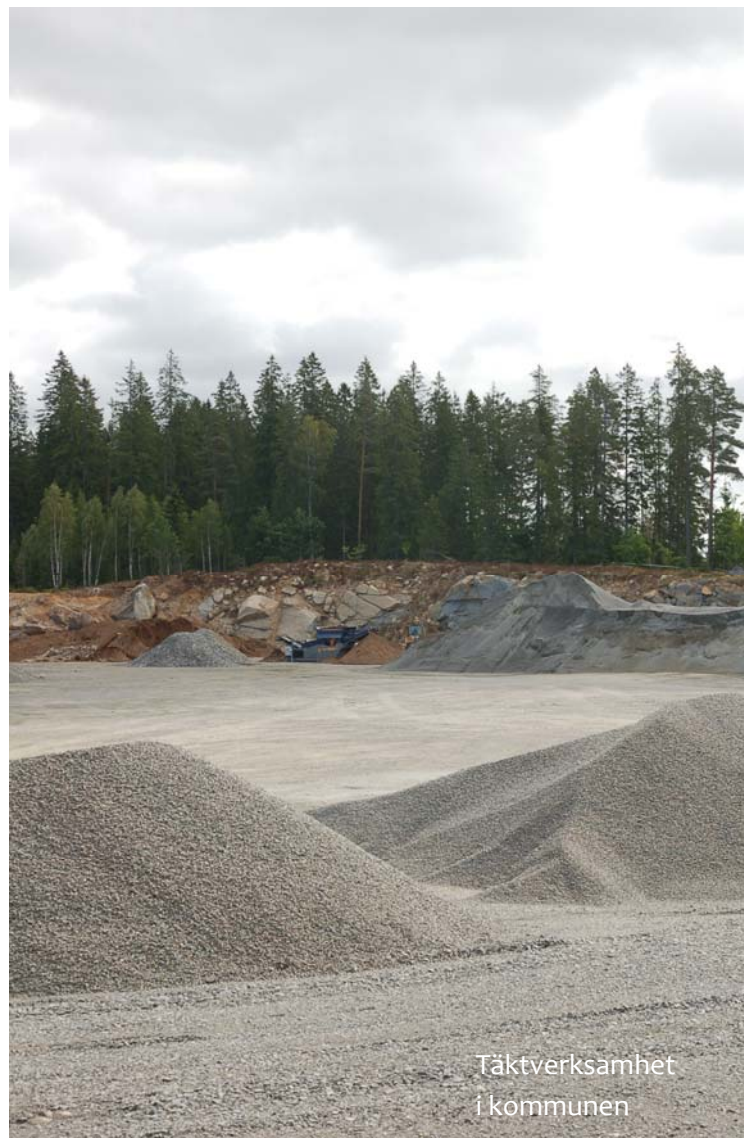
Täktverksamhet i kommunen

Täktverksamheter med tillstånd i Emmaboda kommun visas på karta i kapitlet "Bebyggelse".