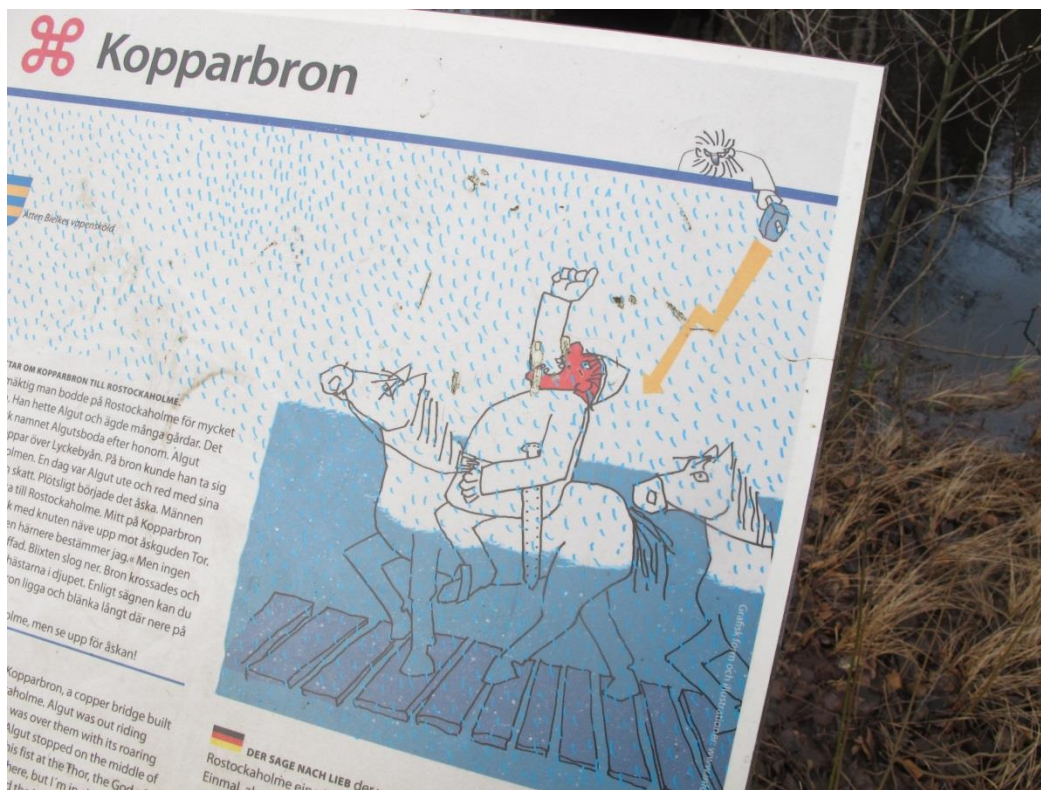
Sågen lever vidare om kopparbron som sjönk i vattnet just här i den gamla häradsgården.