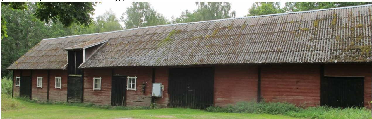
Ladugården till gården A.