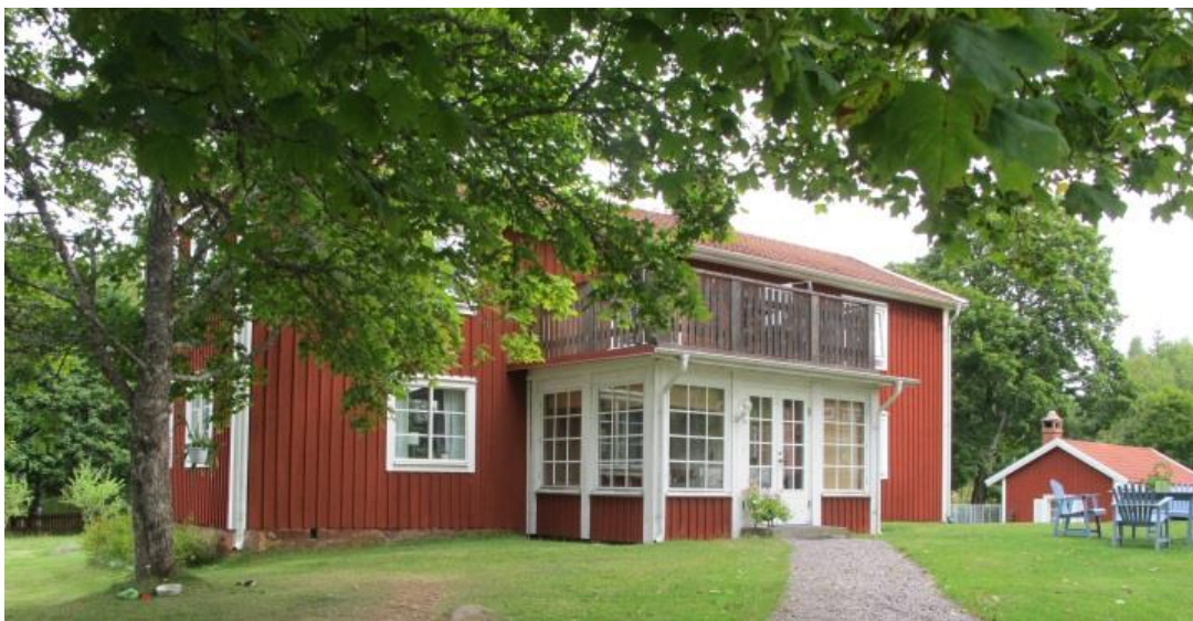
Gården B, flyttad eller nybyggd här efter 1827. Bostadshuset är senare moderniserat (Rostock 1:3).