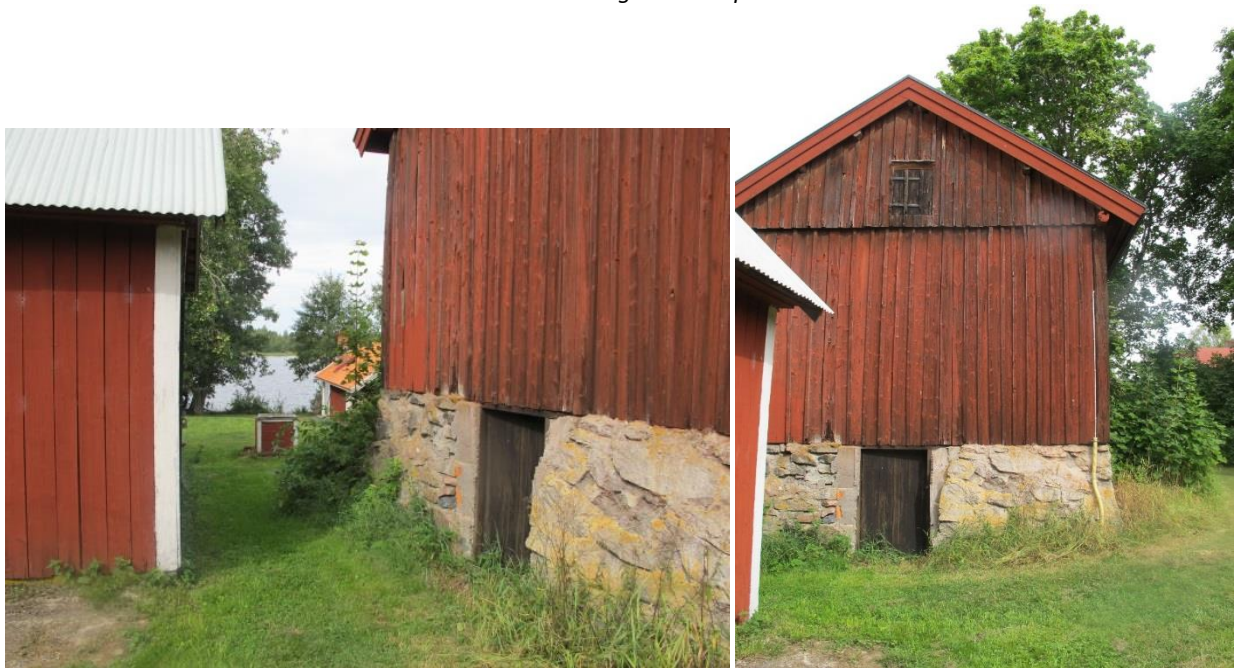
Gården ligger högt med utsikt ner mot sjön. Stenkällare med magasin ovanpå (Gården A, Rostock 1:2).