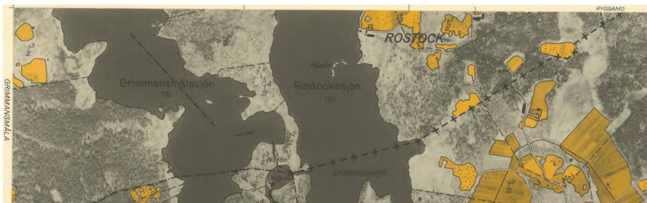
På kartan från ca 1940 syns var den gamla kommun- och häradsgården gick, samt att det fanns flera madhus väster om Grimmansmålasjön och gården A. Från lantmäteriets historiska kartor.

Gården A mitt emot holmen var väl etablerad i samband med att skiftet genomfördes 1825. Den låg då här tätt tillsammans med gården B. Bostadshus och en bod som fanns då är troligen samma som finns kvar idag. Gården hade många hus för olika funktioner. Flera hus ligger nära sjön och har troligen koppling till verksamheter vid vattnet, som fiskrök, sjöbod m.m. Runt sjön fanns också ett antal madhus, som visar på madslätterns betydelse som en del i gårdens ekonomi. Dessa finns ej kvar idag. Gårdens läge och vägens sträckning är desamma idag som på 1820-talet. Gården B flyttade till nuvarande läge efter skiftet på 1820-talet. I byn har också funnits ett soldattorp.