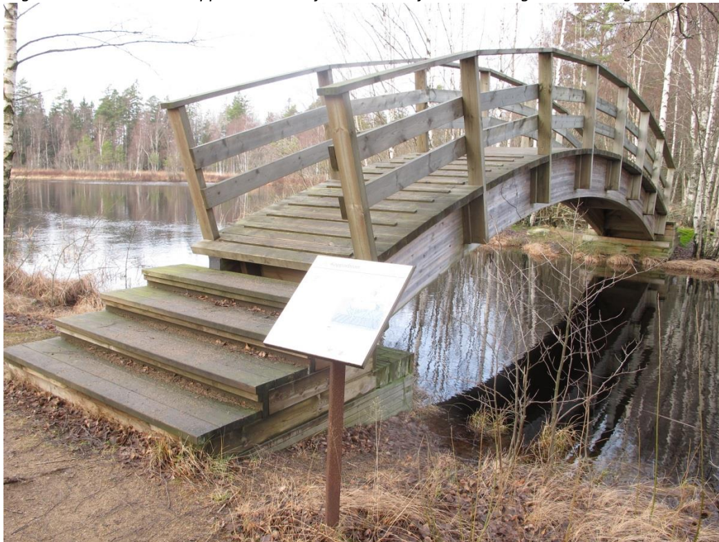
En ny bro som gör det möjligt att komma ut till Rostockaholme.