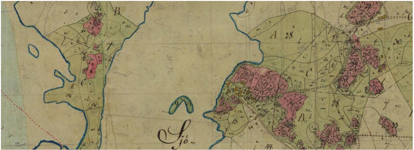
På kartan från 1827 syns hur de två gårdarna A och B ligger tätt samman vid sjön, hur marker är uppodlade på Rostockaholme och hur den norra gården finns, med ladugård och bostadshus i samma läge som idag.