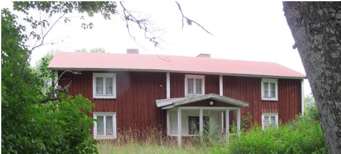
Mangårdsbyggnaden till gården A, kvar i samma läge minst sedan 1700-talet. (Rostock 1:2)