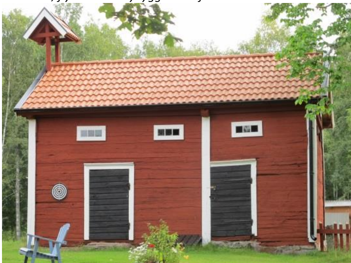
Bevarat magasin med vällingklocka och stenkällare. (Rostock 1:3)