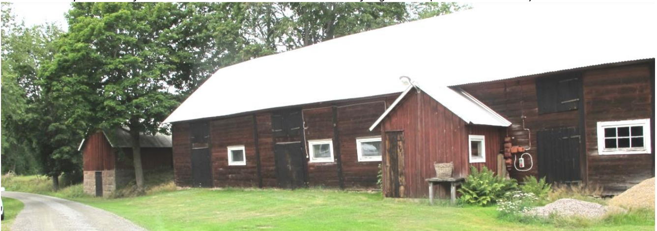
Traditionell gårdsmiljö med vägen igenom. Ladugård i skiftesverk, stenkällare med överbyggnad i trä och bryggghus.