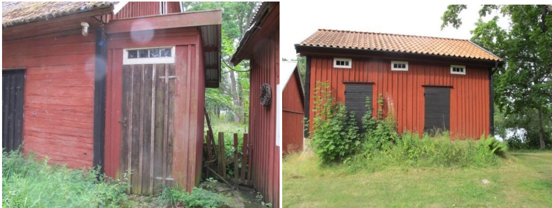
Traditionellt utedass. Den bevarade stenkällaren med magasin ovanpå.