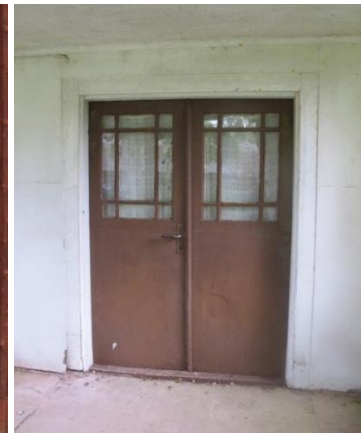
Ålderdomlig takkonstruktion med åsar samt ålderdomliga skorstenar. Välbevarade fönster och dörrar. (Dörren förefaller vara av 1930-talstyp).