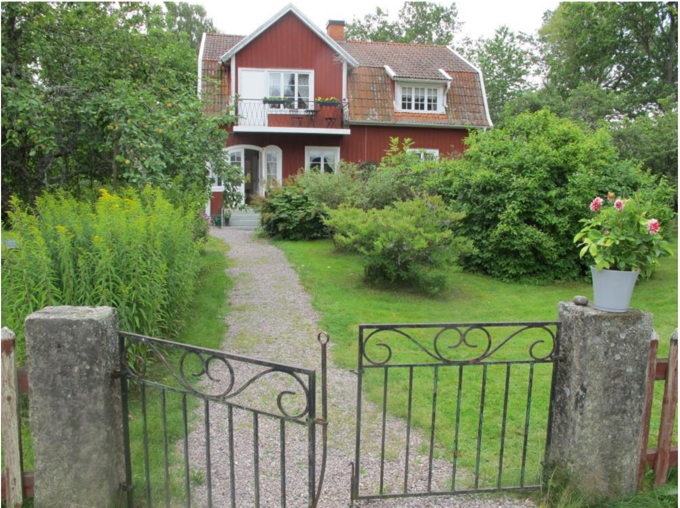
Det gamla bostadshuset från 1800-talet har på gården längst mot norr ersatts med ett nytt på 1920-talet. Detta är idag en välbevarad representant för sin tid. Gården kallas i detta dokument för gården C (del av Rostock 1:2).