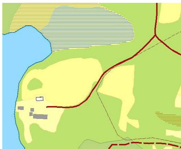
Detalj ur karta från 2013, som visar gården A idag. Bostadshuset är samma, liksom troligen stenkällaren med överbyggnad.