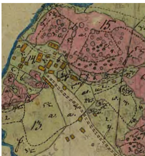
Detalj ur karta från 1827, med en mångfald av hus på gårdarna A och B (innan B flyttades ut).

I Rostocks by finns tre gårdar med till stor del bevarad traditionell bebyggelse, alla faluröda. Gården vid sjön, tidigare benämnd gård A, består idag av en äldre traditionell parstuga i två våningar, med många delar i originalskick, såsom panel, fönster, skorstenar, takkonstruktion m.m. Flera olika ekonomibyggnader samt en bod/magasin på hög stenfot med källare finns också. Den andra gården i byn, gården B, har också traditionella ekonomibyggnader samt en källare med förvaringsbod i trä ovanpå. Bostadshuset som flyttades hit eller nyuppfördes här efter 1827 är idag moderniserat. Den tredje och norra gården i Rostock, här benämnd gården C, ligger på traditionellt sätt, med staket som skiljer mangård från fägård. Ladugården av tidig 1900-talstyp är traditionellt utformad, i skiftesverk, med tillbyggt mjölkkrum, med mjölkpall i trä utanför. Till gården hör ett bryggerhus och ett magasin på hög stenfot/stenkällare. Bostadshuset som finns idag är ett tidstypiskt bostadshus för sin tid, 1920-tal. (Ett äldre bostadshus låg tidigare på samma plats.)