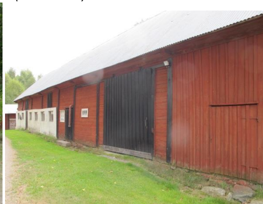
Runt tomten finns traditionellt rödmålat spjälstaket med stenstolpar. Ladugården är också en viktig del av landskapsbilden.