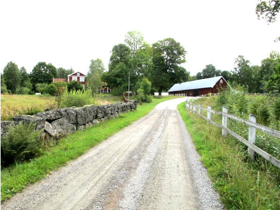
Byvägen är grusväg. Stenmurar och staket ger karaktär åt landskapet.