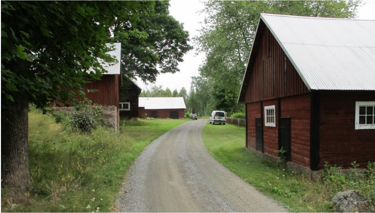
Gården och brygghuset.