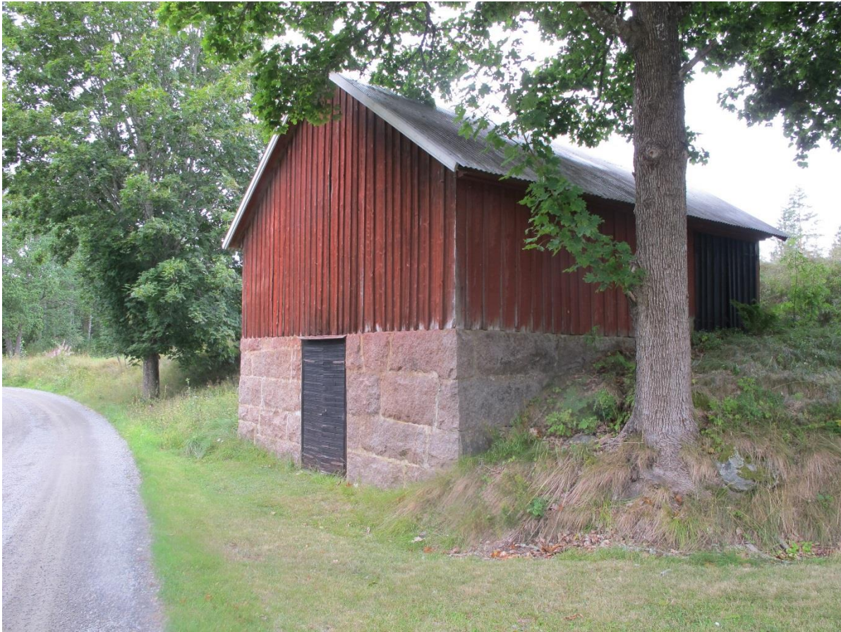
Den överbyggda stenkällaren.